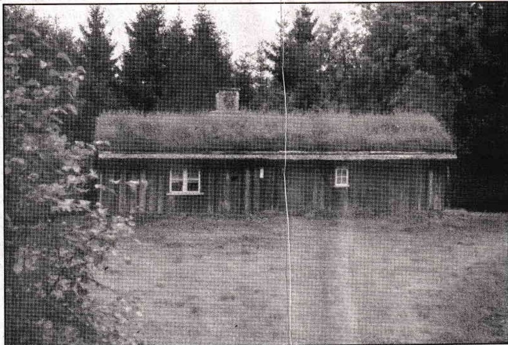
Gran-Annas. Gran-Annas stuga sköts på ett pietetsfullt sätt av Vårkumla hembygdsförenings medlemmar. 4/6 - 47 -

Torpinventering har genomförts och alla kända boplatser är utmärkta med stol-