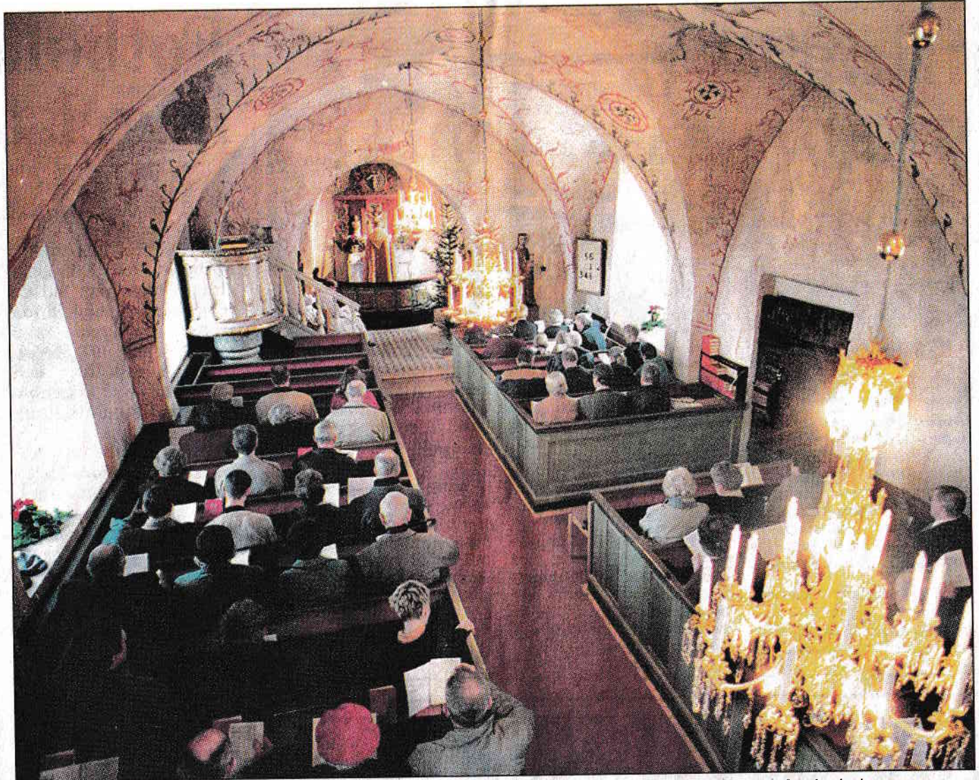
Nästan fullsatt. Många sökte sig till gudstjänsten som förkunnade den medeltida kyrkan som återinvigd. 22/12-97.