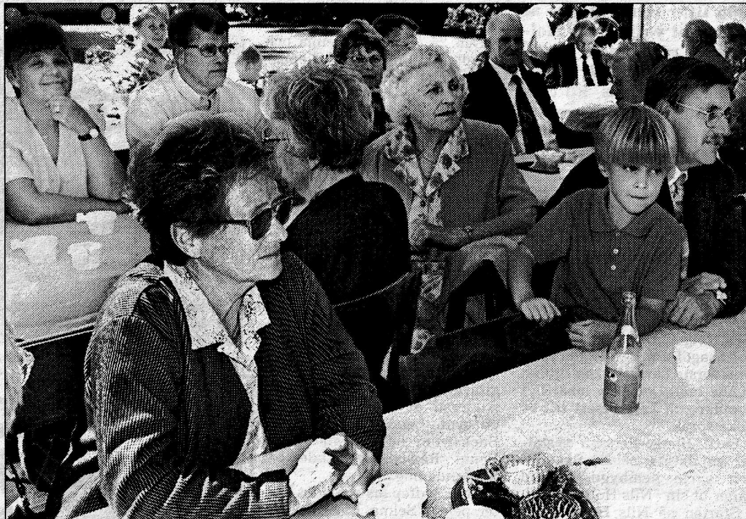
Från bl.a Stockholm, Göteborg, Halland, Värmland och så förstas från Vårkumla kom många generationer till Bygdgården.

- De diskuterade 53 ämnen, berättar hembygdsföreningens