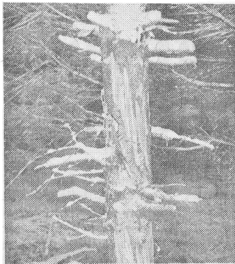
Här har den fyrbente flistuggen tagit sig ett skrov-mål.