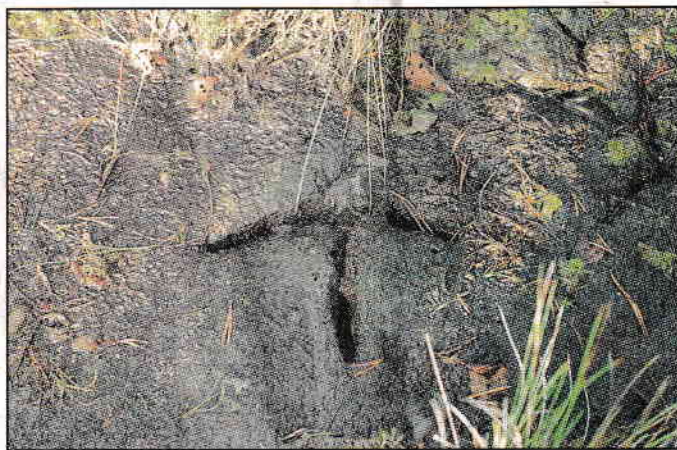
Tranfot. I torvmossen bevaras fotavtryck bättre än på de flesta marktoper – här har Västergötlands landskapsfågel trampat.

bara för att nämna några. Det för sin smak för flugor och andra "köttprodukter" kända silleshåret hittades mitt ute på mossen och fotograferades i närbild. Flera svampar undersöktes också, inte minst kring slutmålet Jansa-Johans stenmur där äng och skogsmark tar vid. Tranbären lyste frastande röda och provsmakades.