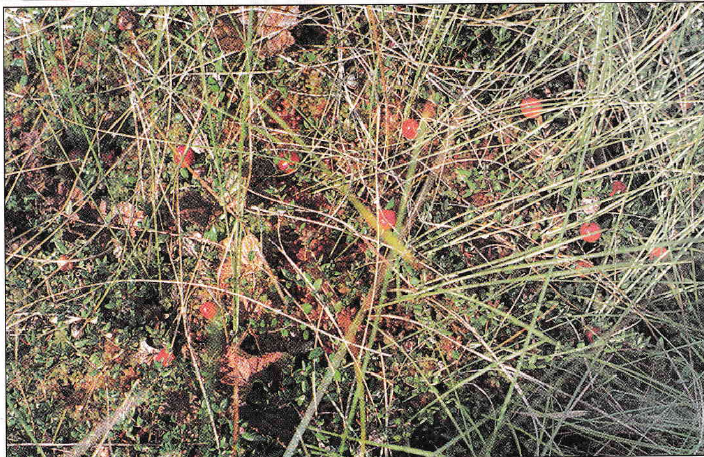
Tranbär. De röda, syrliga bären smakar bäst efter ett par frostnätter, sägs det.