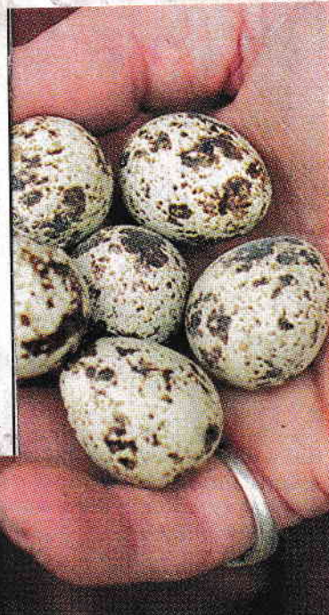
Vaktelägg. Vakteln, en typ av hönsfågel,

– Vi tycker de blir lugnare till musik, förklarar Eva.