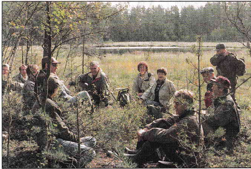
Fikapaus vid Karbosjön. Falbygdens naturskyddsförening fann en vackert plats efter ett par timmars i vandring i lugn takt över mossmarker.

Flera andra intresserade och kunniga medvandrare studerade den botaniska floran som på sina ställen kunde bestå av tuvsäv, tuvull, klockljung, rosling och vitag, detta