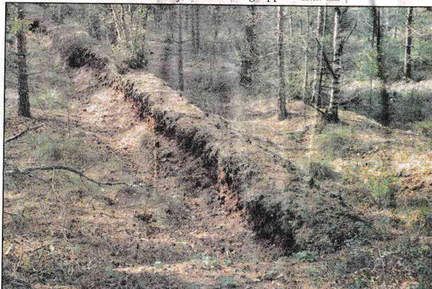
Spår efter torvbrytning. Man kan tydligt se var torvspadarna gått fram, i en del diken står det vatten och smala strängar finns kvar av torvtakten.

Närmast sörjande är maken Anna samt barn och barnbarn.