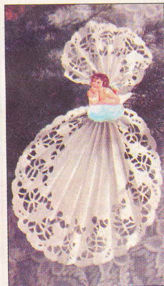
Änglar finns i Vårkumla. Här finns beviset att det finns änglar i Vårkumla även om dom bara är gjorda av vita tårtpapper.