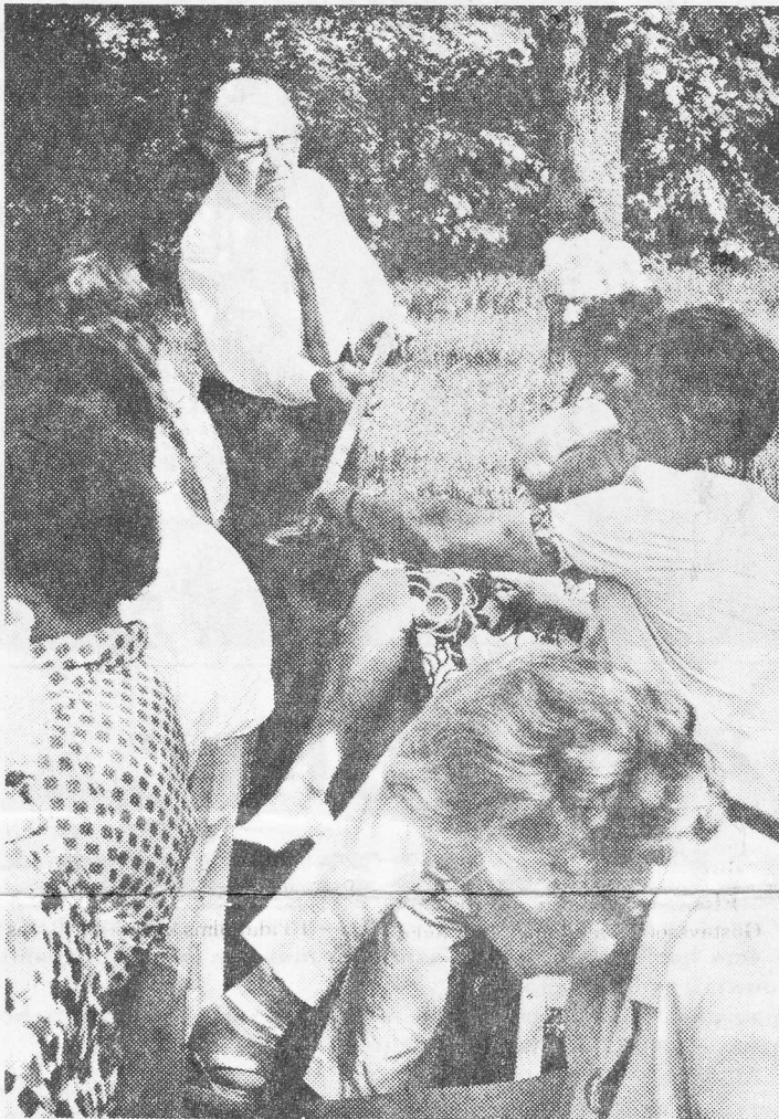
Kollekten togs upp till förmån för Bräcke diakonigård