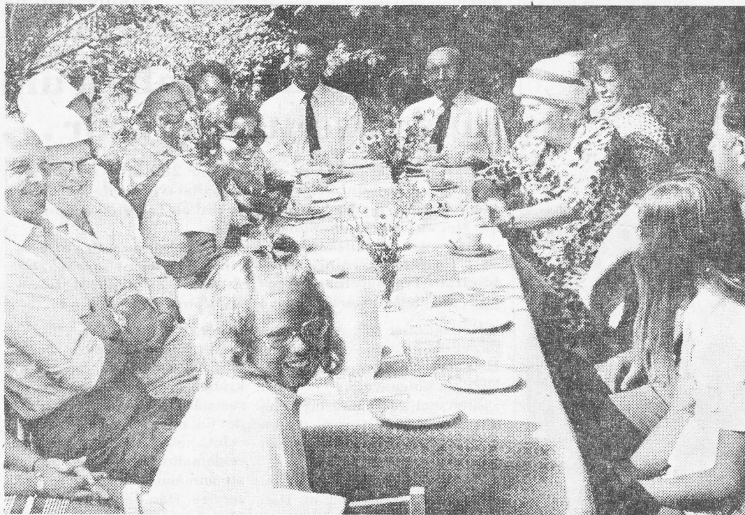
Efter gudstjänsten var det trivsamt samling runt kaffeborden.