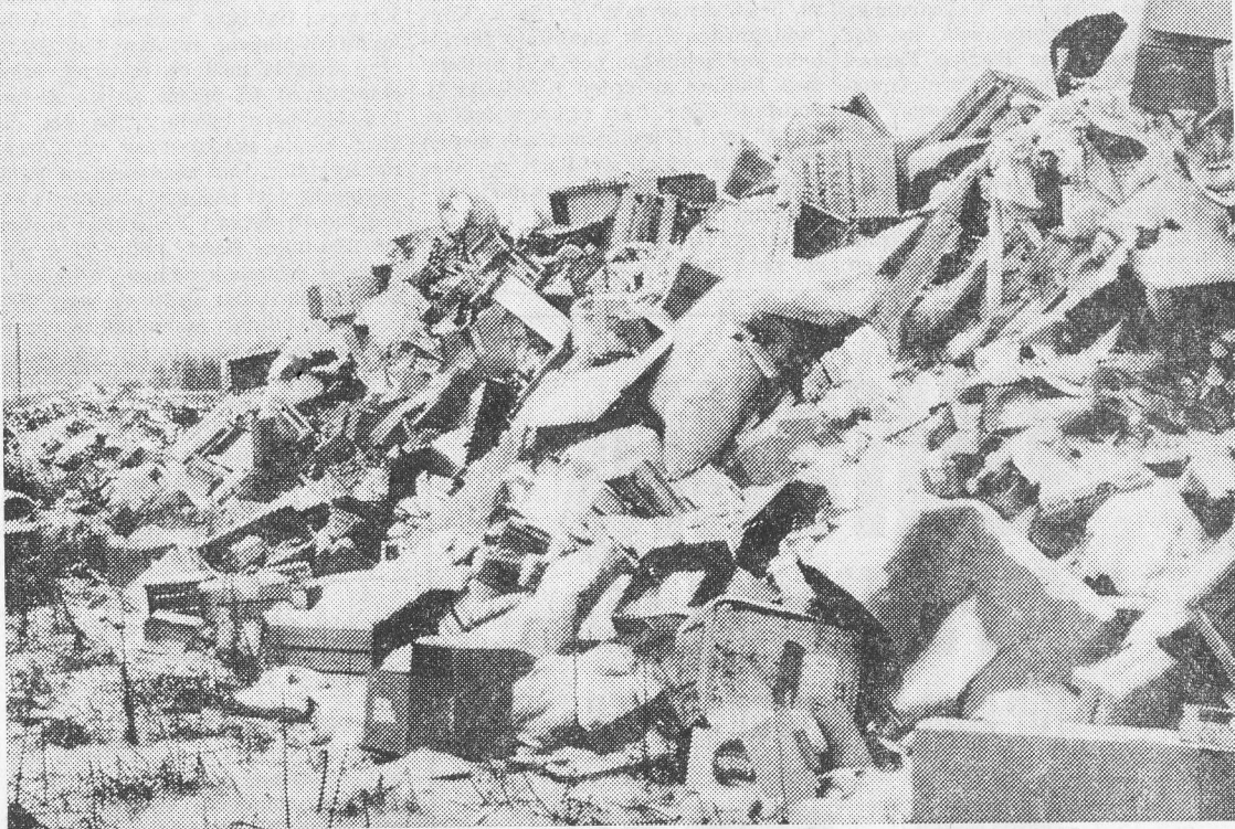
Det här vill Luttra-borna ha stängsel om kring. 2/3-71.