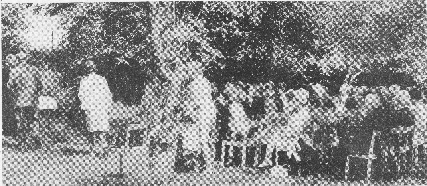
Församlingsborna i Luttra hade tur med vädret, då de samlades till gudstjänst i söndags. Så här trevligt såg det ut i Skövdesgårdens trädgård. 21/7-70.

Det var fint väder även om solen inte sken hela tiden, då Luttra församling firade gudstjänst i det fria på söndagen. Det var en förkortad högmässa som hölls i Skövdesgårdens trädgård. C:a hundratalet församlingsbor