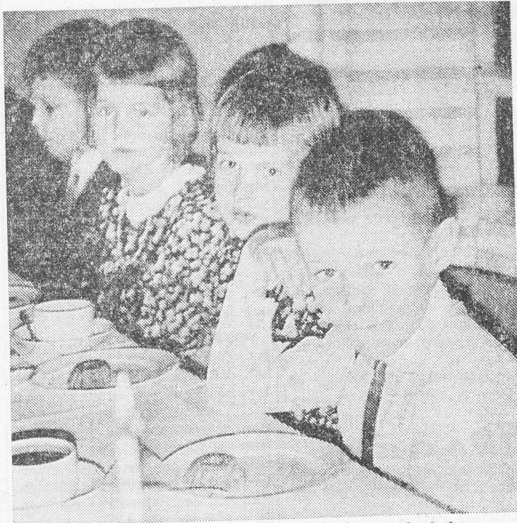
Aven de yngsta var med om att inviga bygdegården.

Den första kvällen i den »nya» bygdegården avslutades med en andaktsstund, som leddes av komminister Möne.