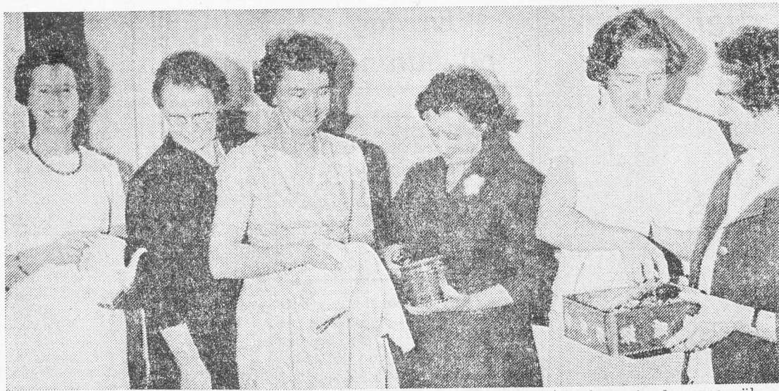
I köket, som också kan användas som lokal vid mindre sammankomster, fann sig damerna väl tillrätta.