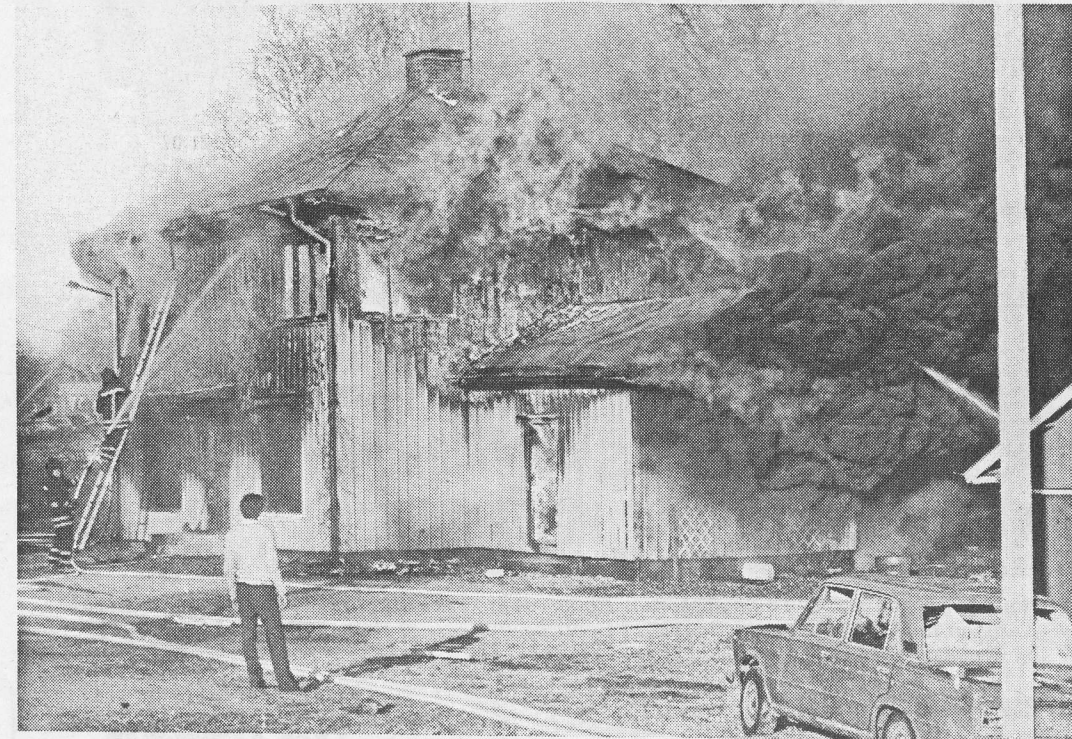
Branden fick snabbt fäste i träbyggnaden och efter mindre än en timme hade taken börjat rasat in.