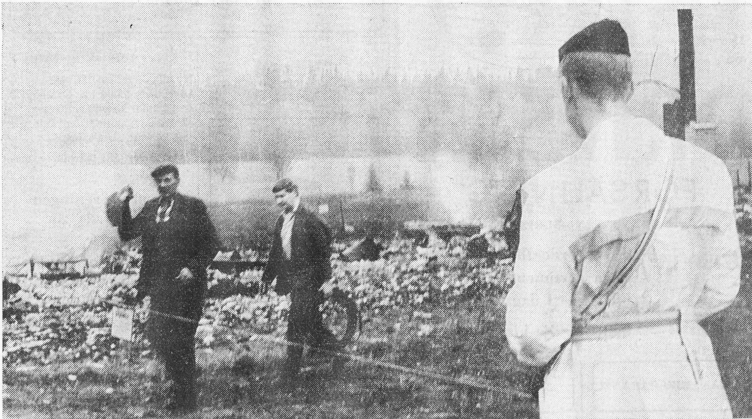
Ladugårdarna brann ned på ett par timmar. Polisen spärrade av platserna för vidare undersökningar. På bilden två elektriker som i går såg till att de drabbade åter fick ström.