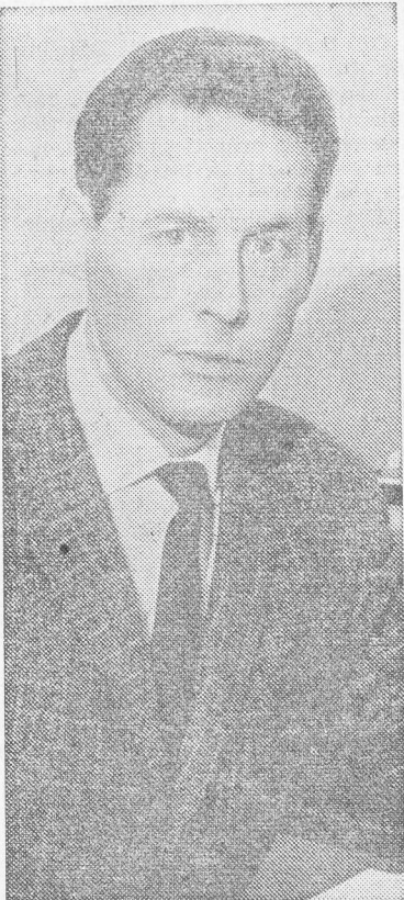
Ordföranden och lagen

— Jag är mycket tacksam för gården. Den är bra att ha vid syföreningsauktioner, församlingsaftnar, ungdomssamlingar och vid många tillfällen. Men några enbart goda erfarenheter av den har jag inte. Jag är mycket ledsen över att man på söndagarna hyrt ut den åt andra samfund och därmed splittrat gudstjänstlivet på orten. Man dansar där, och det förekommer festanordningar på söndagarna. Jag har talat med kyrkvårdarna om detta.