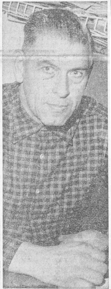
Vice ordföranden och kringblicken