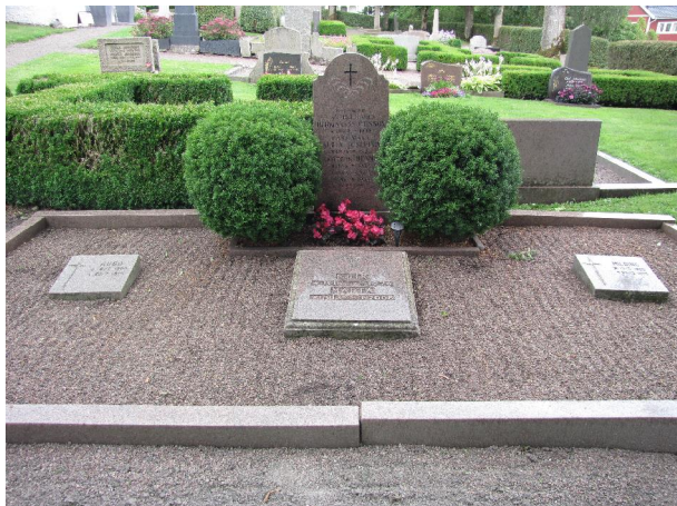
107-110 Tre stenar