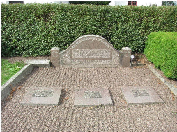
033-034 Fyra stenar