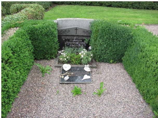
134-135 Två stenar